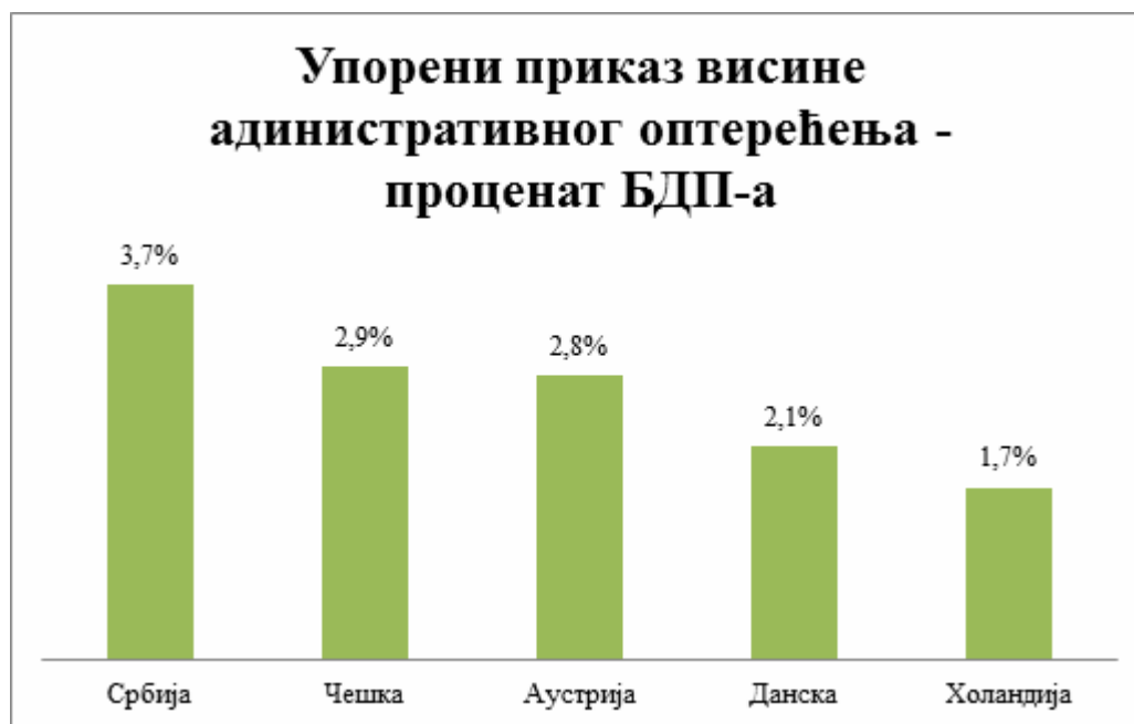
Графикон 2. Упоредни приказ висине административног оптерећења

Према истраживању које је спровео USAID Пројекат за боље услове пословања, административно оптерећење привреде у 2013. години, износило је 3.67% БДП, на основу анализираних 188 најзначајнијих административних поступака.